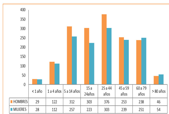
Población según sexo y grupo de edad. Municipio de Viracachá, Boyacá 2018.