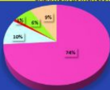
TABLA DE SEMAFORIZACION DE LOS EVENTOS PRECURSORES CHINAVITA BOYACA 2011-2017