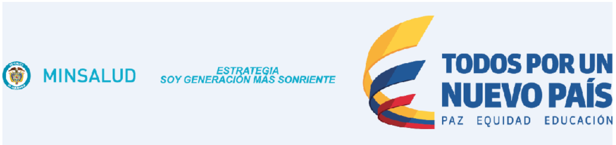
Gráfica 1: Imagen Estrategia SOY GENERACION MAS SONRIENTE

Las ET, EAPB y su red de prestadores, son responsables de la elaboración de material de difusión por los diversos medios.