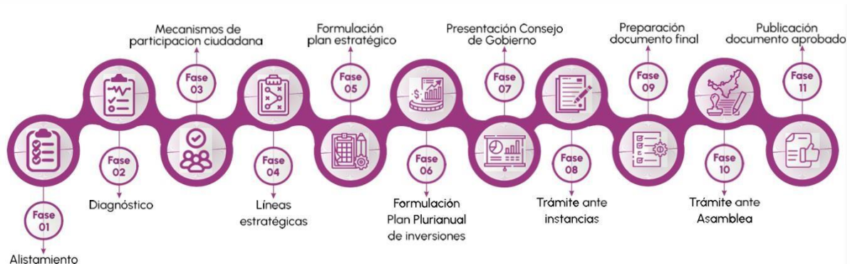
Gráfico 1 Fases del plan departamental de desarrollo.