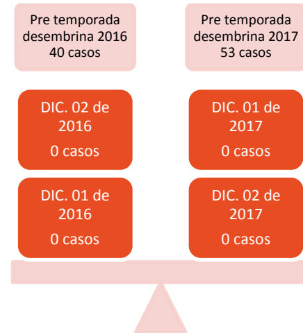
Tabla No 1. Número de casos de las lesiones por pólvora, por fuegos artificiales –Artefactos Pirotécnicos. Temporada Diciembre y fiestas de principio del año, con corte 2 de diciembre de 2017 hora 18 horas.

En el departamento de Boyacá, durante la vigilancia intensificada de lesionados por pólvora (1 de diciembre de 2017 a 13 de enero de 2018) con corte al día 2 de diciembre de 2017 (18 horas), no se reporta ocurrencia de casos de lesionados por pólvora. Al comparar los datos de la presente temporada decembrina con las dos anteriores a corte del día de hoy, se observa que no hay diferencias entre un año y otro