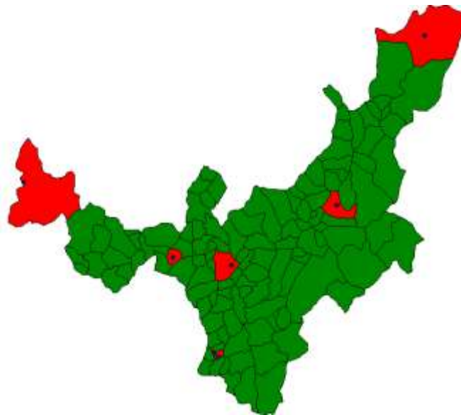
Mapa 1. Georreferenciación de los casos de lesiones ocasionadas por fuegos artificiales y artefactos pirotécnicos, Boyacá, temporada decembrina 2016- 2017, con corte a 26 de Diciembre de 2016 hora 8.am.