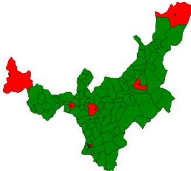
Mapa 1. Georreferenciación de los casos de lesiones ocasionadas por fuegos artificiales y artefactos pirotécnicos, Boyacá, temporada decembrina 2016- 2017, con corte a 25 de Diciembre de 2016 hora 8.am.