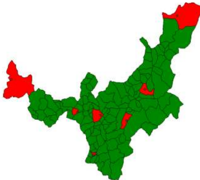
Mapa 1. Georreferenciación de los casos de lesiones ocasionadas por fuegos artificiales y artefactos pirotécnicos, Boyacá, temporada decembrina 2016- 2017, con corte a 31 de Diciembre de 2016 hora 8.am.