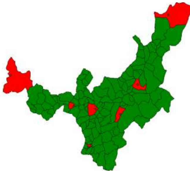
Mapa 1. Georreferenciación de los casos de lesiones ocasionadas por fuegos artificiales y artefactos pirotécnicos, Boyacá, temporada decembrina 2016- 2017, con corte a 29 de Diciembre de 2016 hora 8.am.