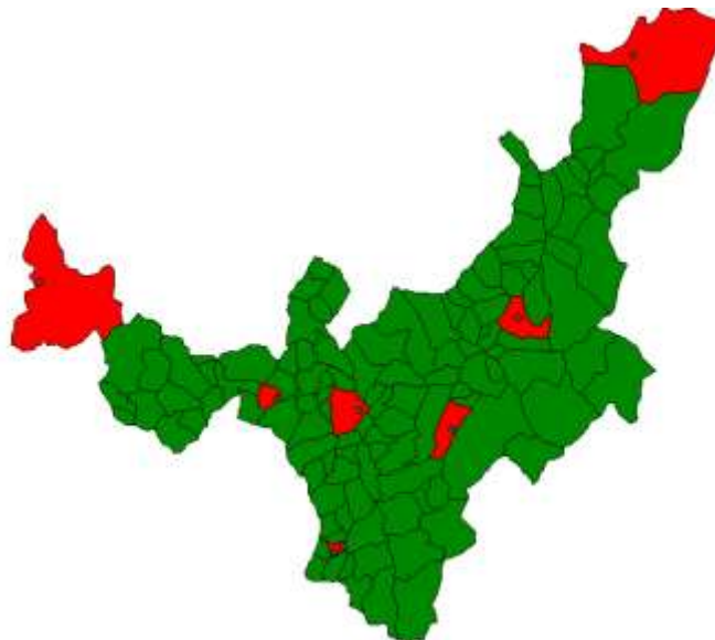
Mapa 1. Georreferenciación de los casos de lesiones ocasionadas por fuegos artificiales y artefactos pirotécnicos, Boyacá, temporada decembrina 2016- 2017, con corte a 30 de Diciembre de 2016 hora 8.am.